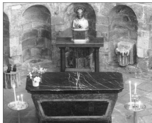
SEPULCRE DEL SANT EN LA CATEDRAL DE VANNES. FRANÇA

Si d'ell ya hem destacat les facetes de conseller i diplomata en el conflicte que supongue el cisma, ad estes s'incrementarà la d'home d'estat en la seua actuacio en el Compromis de Casp . La seua decisio fon vital per a resoldre el problema successori plantejat en la Corona d'Arago a la mort de Marti l'Humà . (Sobre este tema se pot llegir un articul en el Rogle 69, de juny de 2012.)