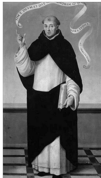
SANT VICENT FERRER, DE JOAN DE JOANES, 1545