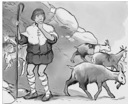
ILUSTRACIO DE MILO WINTER

acusà el pastor d'ingrates per abandonar-lo despuix d'haver-les ates tan