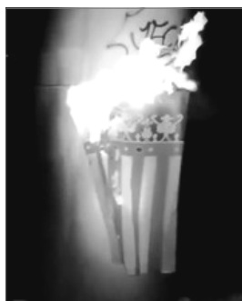
SENYERA CREMADA. FOTO-GRAMA DEL VIDEO DE ARRAN VALENCIA

No deixa de ser cert, i les llinees anteriors en son una mostra; no obstant, hem de dir que, per un costat, la politica ho amera tot, també lo cultural i social, i, per un altre, que si be opinem de politica, sempre procurem no fer partidisme. Sí es cert que hem demanat en mes d'una ocasió explicitament el vot per als partits d'estricta obediencia valenciana, nomenant als que se presentaven a les eleccions, pero sense prendre partit per ningú (la mencio a un d'ells en particular en est escrit ve obligada per les circumstancies). I si critiquem als atres partits no es per la seua orientacio d'esquerres, de dretes o de qualsevol atre posicionament, sino nomes en la mida en la que les seues accions o declaracions van en benefici o perjuí del poble valencià. Per lo manco, segons el nostre criteri; sense dubte, discutible.