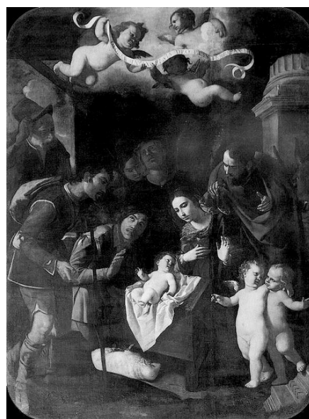
ADORACIÓ DELS PASTORS, DE JERONI JACINT ESPINOSA. IGLESIA PARROQUIAL DE NOSTRA SENYORA DELS ÀNGELS. CHELVA

El Rogle els desija un Nadal ple de pau i harmonia i un molt feliç Any 2020