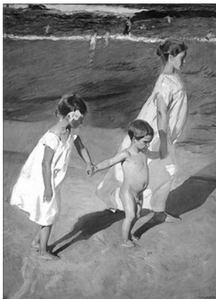
A L'AIGUA, DE JOAQUIM SOROLLA

Se situen els participants darrere d'una línia. Duran penjat cascu un cresol encas a l'altura de la cintura (bragueta). Al crit de "¡Ya!", inicien una carrera que haura de cobrir una distancia previamente senyalada. Hauran d'arribar a la meta en el cresol encas i sense tacar-se ni cremar-se la roba, ni tampoc les vergonyes. Guanya qui primer arriba a la meta.