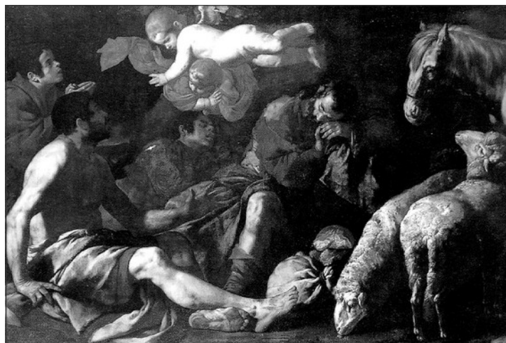
ANUNCI ALS PASTORS, DE JOAN DÒ (ATRIBUIT). GALLERIA NAPOLETANA

Pastorets i pastoretetes tan sabuts que voleu ser d'una barcella de dacsa ¿quants bunyols se poden fer?