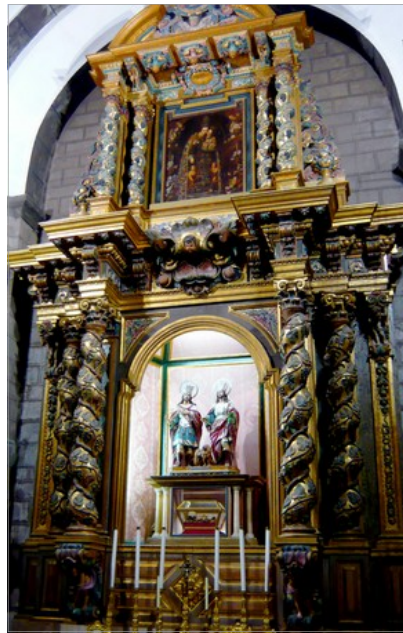
ALTAR DEDICAT A SANT ABDÓN I SANT SENENT EN L'IGLESIA DE SANTA MARIA DE SAGUNT