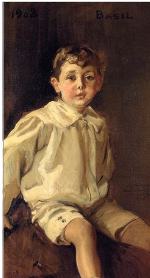
RETRAT DE BASIL MUNDY, DE JOAQUIM SOROLLA, 1908

Ultim pas: Una volta la cançoneta queda muda, sense cap paraula, es tractarà d'anar recuperant les paraules fins a completar-la de nou.