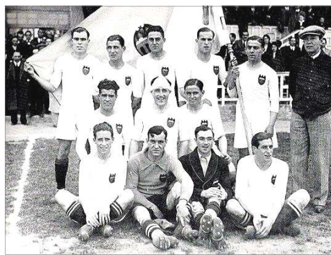
EQUIP DE L'ASCENS, 1931