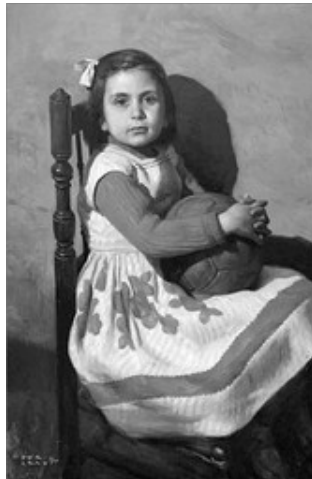
CHIQUETA DEL BALO, DE PERIS ARAGÓ

(* Junquillo era com dien al canó, l'aixeta per a on ix l'aigua de les fonts. Es paraula castellana.)