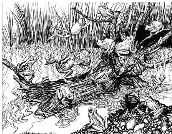
IL·LUSTRACIÓ D'ARTHUR RACKHAM

Espantades les granotes pel soroll que feu al caure, s'amagaren a on millor pogueren. Per fi, veient que el tronc no es movia més, anaren eixint a la superfície i, donada la quietut que predominava, començaren a sentir tan gran despreu pel nou rei, que botaven sobre ell i se li assentaven damunt, burlant-se sense descans.