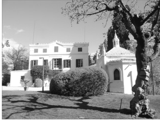
CASA I CAPELLA

L'Hort de Trenor es un dels espais arboreus marcats i en encant del que poden presumir els torrentins; ademés, l'Ajuntament, per a potenciar el seu ús, programa durant l'any tota una serie d'activitats que van des de les edicions de la fira de les flors fins els concerts de jazz en estiu, sense oblidar les activitats didàctiques per a chiquets les fins de setmana. També els professors disposen d'una aula oberta per a impartir les seues lliçons sobre el mig natural. Inexcusablement un lloc per a no deixar de visitar i fruit.