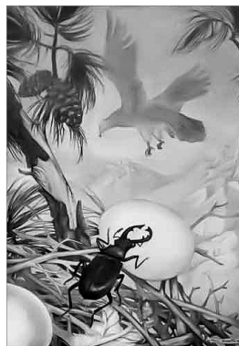
IL·LUSTRACIÓ DE MILO WINTER, 1919

Des de llavors, buscant venjar-se, l' escarabat observava els llocs a on l'aguila