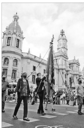
LA PROCESSÓ DE LA VESPRADA AL SEU PAS PER LA PLAÇA DE L'AJUNTAMENT

Per la vesprada, també hi hague convocatori en el Parterre, però l'acte més popular i numeros del dia el protagonisaren els simpatizants de les entitats que, baix l'eslogan "Tots baix els plecs de la Real Senyera", convocaren Colectiu Corona de Gais i Lesbianes del Regne de Valencia, GAV, Joventuts del GAV, Rogle Constanti Llombart, Convencio Valencianista, Plataforma Jovenil Valencianista i A. C. Roc Chabàs-La Marina . S'organisà una processó que escoltava a la Real Senyera del Grup d'Accio Valencianista , eixemplar facsimil de la que es conserva en el Museu Historic de Valencia ciutat. Fon un acte cívic, ben organisat, en abundant participació i que transcorregue ordenadament per