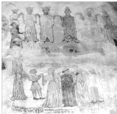
DANSA DE LA MORT. PINTURA MURAL EN LA SALA CAPITULAR DEL CONVENT DE SANT FRANCESC DE MORELLA. PINTADA EN EL SIGLE XV

Aço originà la tradició d'acudir al cementeri a visitar als familiars i sers volguts allí soterrats, un ritual que com porta el recordatori dels que ya no estan; normalment s'ha fet una visita previa algun dia anterior per a adecentar i acondicionar lapides, panteons i