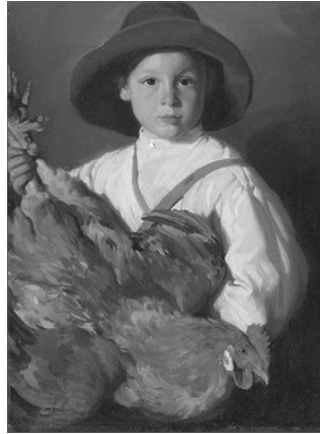
EL CHIC DE LA GALLINA, DE BENEDITO VIVES, 1913

Aixina se repetixen les jugades fins a cansar-se. En acabant, assentats en terra i fent rogle se passen les prendes. L’ultim que havia quedat enmig crida: “¡Prou!”, i van complint les ordens que se’ls ha donat als qui han pagat prenda per a que la puguen recuperar.