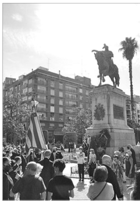
ELS CAVALLERS DEL CENTENAR DE LA PLOMA EN EL PARTERRE

Enguany la celebració de la festa del 9 d'Octubre ha seguit diferent. En el Cap i Casal , privats de la processó cívica que presidix la Real Senyera i en la que les autoritats i institucions fan homenage al rei Jaume I , no han faltat unes atres manifestacions, polítiques, religioses, cíviques i també "incíviques", protagonisades estes últimes per grups antisistema i pro-pancatalanistes.