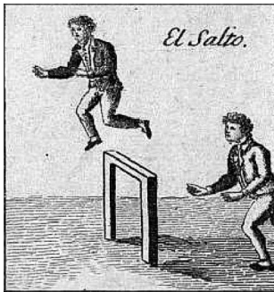
DESCRIPCIÓN DE LOS JUEGOS DE LA INFANCIA, DE VICENTE NAHARRO, 1818, PAGINA 18 (FRAGMENT)

Per a botar s'ha de prendre carrera des d'una distancia de 15 o 20 passos de la vara, canya... El jugador que falle i entropede en esta barrera queda eliminat.