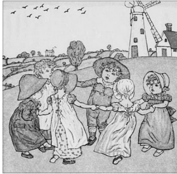
IL·LUSTRACIÓ DE KATE GREENAWAY, 1881.

Se deixen caure i comencen les rialles entre ells, porque aço els sol fer gracia.