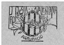
SAGELL DE L'AGRUPACIÓ PRO POESIA VALENCIANA

Ademés de la seua faceta d'escriptor, fon un ferm defensor de la llengua valenciana i de l'oficialització d'esta, ya que en els anys vint l'única llengua oficial era la castellana. Realisà multitud d'estudis, conferències i mitjans en defensa del nostre