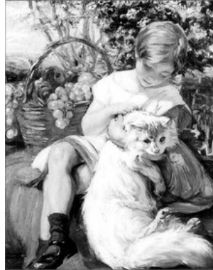
EL GAT D'ANGORA, DE JOSEP MONGRELL

En acabant, si se va establir que se pague penyora, per a recuperar-la, el que falla ha d'obedir l'orde de l'amo i complir els castics mes variats, difícils o ridiculs. En tot cas, sempre acaba sent divertit i entretingut.