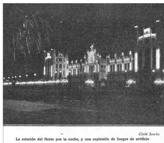
ESTACION DEL NORT ALLUMENADA