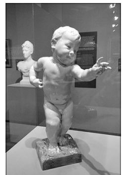
LA PRIMERA ALEGRIA, 1933

València es la ciutat, despuix de Madrid , que mes escultura publica de Marià Benlliure conserva, sent destacables, a banda de les obres ya citades, els monuments dedicats a Cervantes , al pintor Francesc Domingo —al que admirà com a mestre—, o a Eduart Escalante ; tambe les virtuts que decoren la frontera principal de l'ajuntament de València, o el seu tumul funerari en el cementeri del Cabanyal.