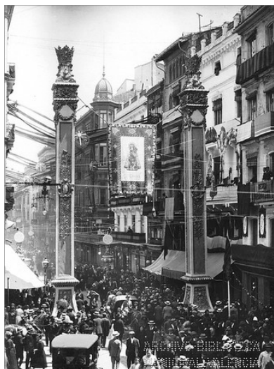
CARRER LA PAU ENGALANAT. FOTO BARBERÀ MASIP

En la Crónica de las solemnes fiestas celebradas en Valencia con motivo de la Coronación Pontificia de la Imagen de Nuestra Señora de los Desamparados (1923) u dels capituls es dedica a deixar constància de "Adornos, iluminaciones, fuegos artificiales y músicas", en alguns comentaris com: