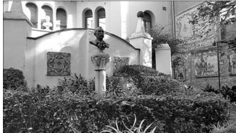
VISTA DEL JARDI DE LA CASA-MUSEU BENLLIURE

El Ajuntament de València , localitat natal