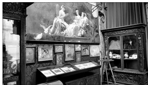
VISTA DE L'ESTUDI DE LA CASA-MUSEU

de Benlliure i a on se formaria com artista, tampoc es que haja donat massa transcendencia a qui es fill predilecte de la Ciutat i artista de fama universal. Constituixen el gros de la celebracio la represtinacio de dos de les seues obres situades en la via publica: les dedicades al pintor Ribera i al Marqués de Campo ; a lo que s'ha de sumar una exposicio en la Casa-Museu Benlliure i una atra, molt senzilla, en els fondos que conserva el Archiu Historic Municipal , en el Palau de Cervello . Eduart Escalante ; El Rogle dedicà un articul a la vida i obra de l'artista en el bolleti numero 72 de setembre de 2012, pero esta era una ocasio per a deixar constancia del considerat com l'últim gran mestre del realisme decimononic, el qual gojà de l'amistat de dos grans genis internacionals: el seu amic Vicent Blasco