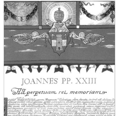
BULA PAPAL. FRAGMENT

Però entre totes les advocacions que els fidels cristians d'esta regió solen aclamar a la Santíssima Verge Maria preva la de MARE DE DESAMPARATS , advocació dolcíssima que arreplega i expressa la doctrina sagrada que relaciona a la família humana en les singulars prerrogatives de la Mare de Deu. I esta advocació centra la pietat mariana de València no únicament en estos últims temps o des de fa poc, sino des de temps immemorials a través de llargues generacions i en l'eixemple i entusiasme de varons exímis en santetat i lletres. [...]