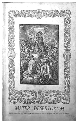
MATER DESERTORUM , 189. SUPLEMENT DEL BOLLETI OFICIAL DE L'ARQUEBISBAT DEDICAT A LA PROCLAMACIÓ DEL PATRONAT REGIONAL. 1961

Puix efectivament hui se pot assegurar que des d'un confí a l'atre d'esta terra privilegiada de Deu, des del Maestrat fins a Oriola, no es trobaria un sol poble, per menut i desconegut que siga, que no tinga escollida devoció a la Mare Celestial en algun dels seus misteris i invocacions principals [...].”