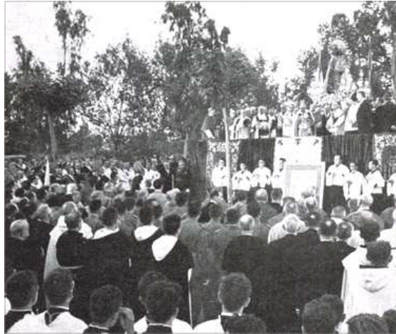
ACTE DE LA PROCLAMACIÓ. ESPLANADA DEL PONT DEL REAL. VALÈNCIA CIUTAT

olaechea , el bisbe de Sogorp-Castello, José Pont i Gol , i el d'Oriola-Alacant, Pablo Barrachina Estevan , firmaven una carta pastoral en les disposicions a seguir en els actes de la celebració religiosa per a donar gràcies i en senyal de goig, la qual tindria lloc el dia 29, dissabte, en tot el Regne de València : a les set de la vesprada volteig general de campanes en totes les parroquies de les tres diòcesis i, a la fi d'eixa vesprada, un acte d'acció de gràcies en cadascuna d'elles en el cant de la Salve i de l'oració litúrgica de la Patrona . Es reservava la data del 13 de maig (dissabte) per a la proclamació oficial, a la qual invitava l'arquebisbe a tots els valencians a través d'una allocució de ràdio en les emissores existents en la ciutat.