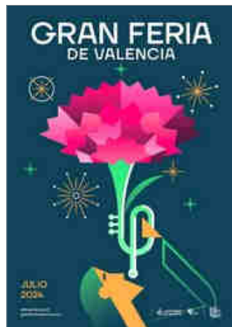
CARTELL DE LA FIRA DE JULIOL DE VALÈNCIA DE 2024, DE VICENT RAMÓN