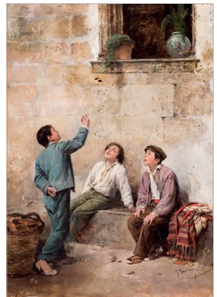
CHICONS JUGANT, DE JOSEP BENLLIURE, 1879

Possiblement siga este el joc mes complicat en boletes i se necessita molta atenció i, sobre tot serenitat i complir les normes establides.