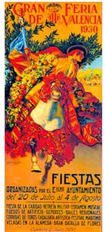
CARTELL DE LA FIRA DE JULIOL DE VALÈNCIA DE 1930, DE BARTOLOMÉ MONGRELL