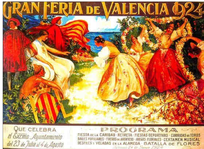
CARTELL DE LA FIRA DE JULIOL DE VALÈNCIA DE 1924, DE BARTOLOMÉ MONGRELL

Seguir el camí d'artistes com els que he nomenat, capaços d'incloure en les seues obres algun o alguns elements que nos ancoren a València, a la seua tradició festiva i identitària, seria una línia a reforçar en les bases d'una nova convocatòria cartellística. Ademés, s'hauria de garantir, fora quina fora la tècnica i el suport de l'obra premiada, que no deixes de formar part de les col·leccions que me consta conserva l'Ajuntament de València en el seu Archiu Municipal.