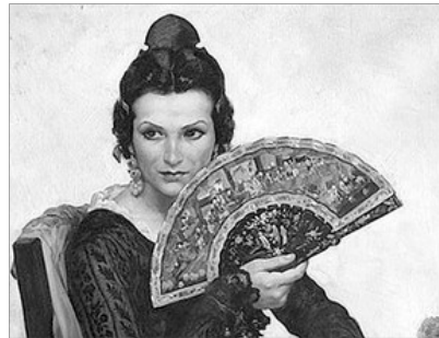
RETRAT DE VALENCIANA EN PALMITO (DETALL), DE LLUÍS DUBON