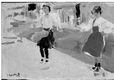
BOTANT A LA CORDA, DE JOAQUIM SOROLLA