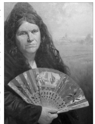
LA COMARE DE FOYOS (DETALL), D'ANTONI FILLOL