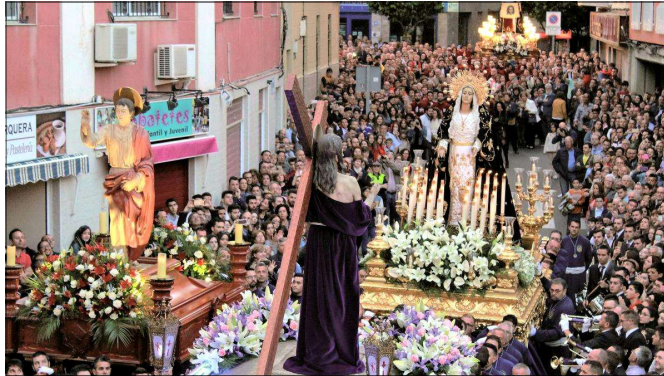
ABRAÇ DE LA MORQUERA