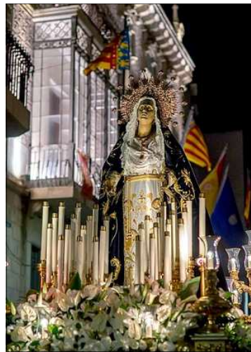
MARE DE DEU DELS DOLORS, OBRA DE MARIÀ BENLLIURE

Destacar que enguany se complix el centenari de la revista Crevillente. Fiestas de Semana Santa , dedicada a la celebració.