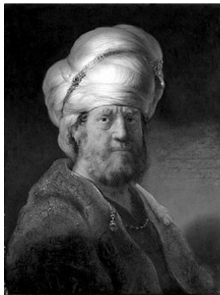
HOME EN TURBANT, DE REM-BRANDT, 1635

Un dia el mestre sufi Nasrudi aparegue en la cort, cobert en un magnific turbant , per a demanar diners per a caritat.