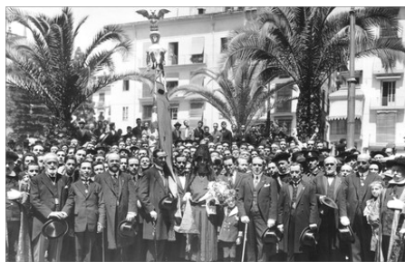
LA COMITIVA EN LA PLAZA DE LA MARE DE DÉU EN ACABANT LA BENEDICCIÓN.

“Hemos tomado parte de un acto de patriotismo valenciano, porque el patriotismo es religiosidad, en agradecimiento y correspondencia a Dios, que nos dió la tierra bendita en que nacimos.