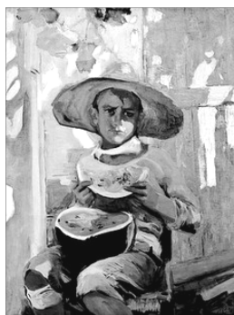
EL CHIQUET DEL MELO D'ALGER, DE JOAQUIM SOROLLA

Els demés van botant-lo d'u en u, posant les dos mans sobre l'esquena de qui paga i procurant al botar no colpejar-lo en les cames ni caure en terra. Si ocorreguera alguna d'estes