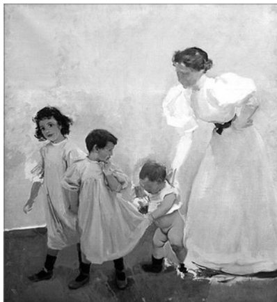
LA MEUA DONA I ELS MEUS FILLS DE JOAQUIM SOROLLA, 1910

La competició era per a demostrar qui era el chicon més fort i hàbil; per tant era un joc propi dels chics fadrins.