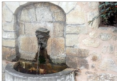
FONT D'AL-AZRAQ, EN ALCALÀ DE LA JOVADA

En l'arrenc de la primavera esclatà la rebel·lió dels musulmans, recolzats pels ginets benimerins, i el rei manà que s'atacara als enemics, pero en prudència i permetent als musulmans tornar als seus pobles si es rendien pacíficament. Jaume I es desplaçà a Xàtiva per a estar prop del front de guerra, i des d'allí envià quaranta hòmens a cavall per a reforçar Alcoy i Cocentaina. En això, arribà Al-Azraq enfront d'Alcoy al cap de doscents cinquanta ginets, provablement benimerins, i, encara que els cristians patiren una derrota, en la brega muigué Al-Azraq, en abril de 1276. D'eixa manera, naixqué la llegenda que donà oríge a les festes emblemàtiques del sur valencià. En juliol faltà Jaume I.