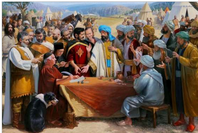
PACTE DEL POUET, DE JOSEP BORRELL