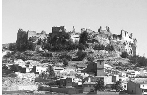
RUÏNES DEL CASTELL DE MONTESA

Luis Despuig va ser mestre durant vintinou anys. Contemporàneu d'Alfons el Magnànim, Joan II i Ferrando II , participa en les campanyes de Sicília d'Alfons i actua com a embaixador seu. Intervé en tots els avatars del regnat de Joan II, el més