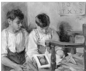
ESCENA DE CHIQUETS, DE RAFAEL BERENGUER

Aixina fins l'agotament o quan es feya hora de sopar.