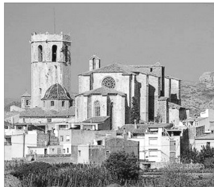
SANT MATEU. IGLESIA ARCHIPRESTAL