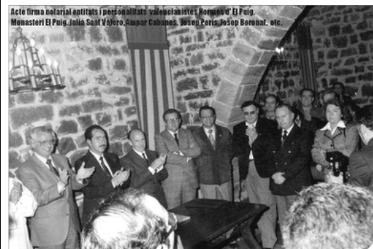
ACTE DE LA FIRMA DE LES NORMES D'EL PUIG, 1981

El segon pas podria ser conseguir un pacte de concòrdia, estendre a totes les entitats valencianistes el message de que no estigmatizaren ni rebujaren cap treball narratiu, poetic o d'investigació que es presente a concurs o certamen lliterari en qualsevol dels dos sistemes d'accentuació.