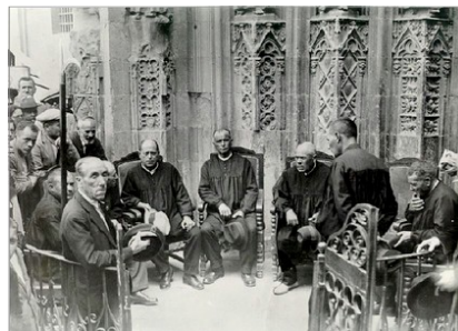
EL TRIBUNAL EN 1934