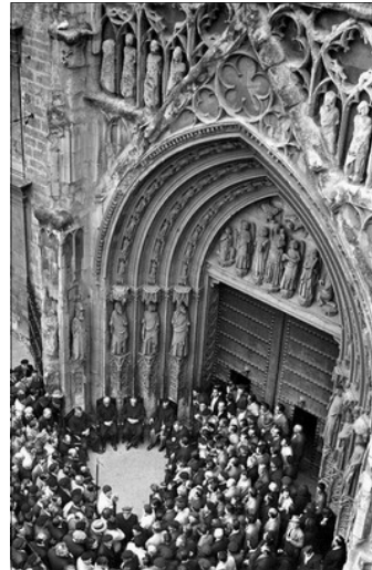
EL TRIBUNAL EN 1958