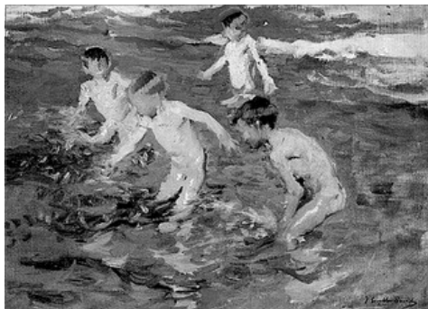
EL BANY, DE JOAQUIM SOROLLA, 1899

El joc acabava quan tots estaven caçats o quan les mares, des de la porta de casa o des de la finestra llançava l’avis de: “¡O puges o baixa (mes el nom del cridat!)”, moltes vegades seguit de: “¡O envie a ton pare!”.