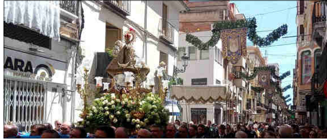
L'IMATGE EN UN CARRER ENGALANAT

El tradicional Pregonet que es celebra tots els anys per a anunciar l'entrada de maig, més de Maria, ha tingut molta més rellevància pel centenari, provessó encapçalada pels estandarts dels patrons de la ciutat, Sant Cristòfol, Sant Blai i la Mare de