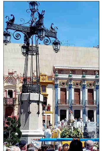
ACTE COMMEMORATIU EN LA FAROLA

– "Más de 130 actos para celebrar el primer centenario de la Coronación de la Mare de Déu del Lledó" ( Castellón Plaza , 2.4.2024)