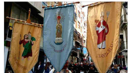
ESTANDARTS EN EL PREGONET