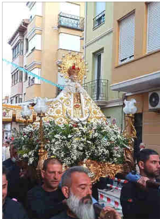
EN EL RAVAL

En l'exposició Coronatio Virginis s'ha pogut contemplar el Mant del Centenari , confeccionat per un taller sevillà i pagat per subscripció popular, entre uns altres objectes religiosos i artístics. També se pogué vore el documental 'Coronación de